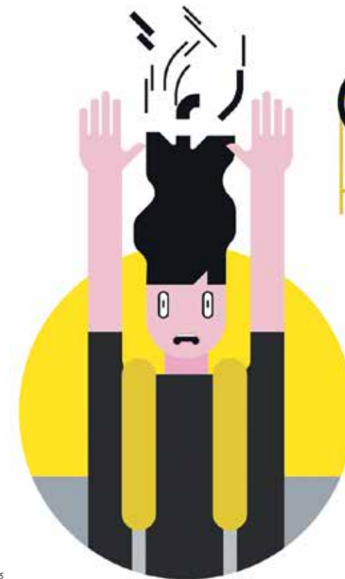
GRAPHIC: DASHA ZACHAWA

Wäre die Krankheit nicht gekommen, wenn ich meine Wut und Frustrationen rausgeboxt hätte statt sie lösungsorientiert, mit zusammengebissenen Zähnen zu transformieren? Hätte ich meine Arbeitsplätze eher wechseln sollen? War ich möglicherweise zu negativ? War es der Tod meiner Mutter?